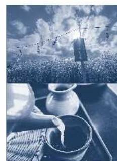
フォトコンテスト 2022年受賞作品